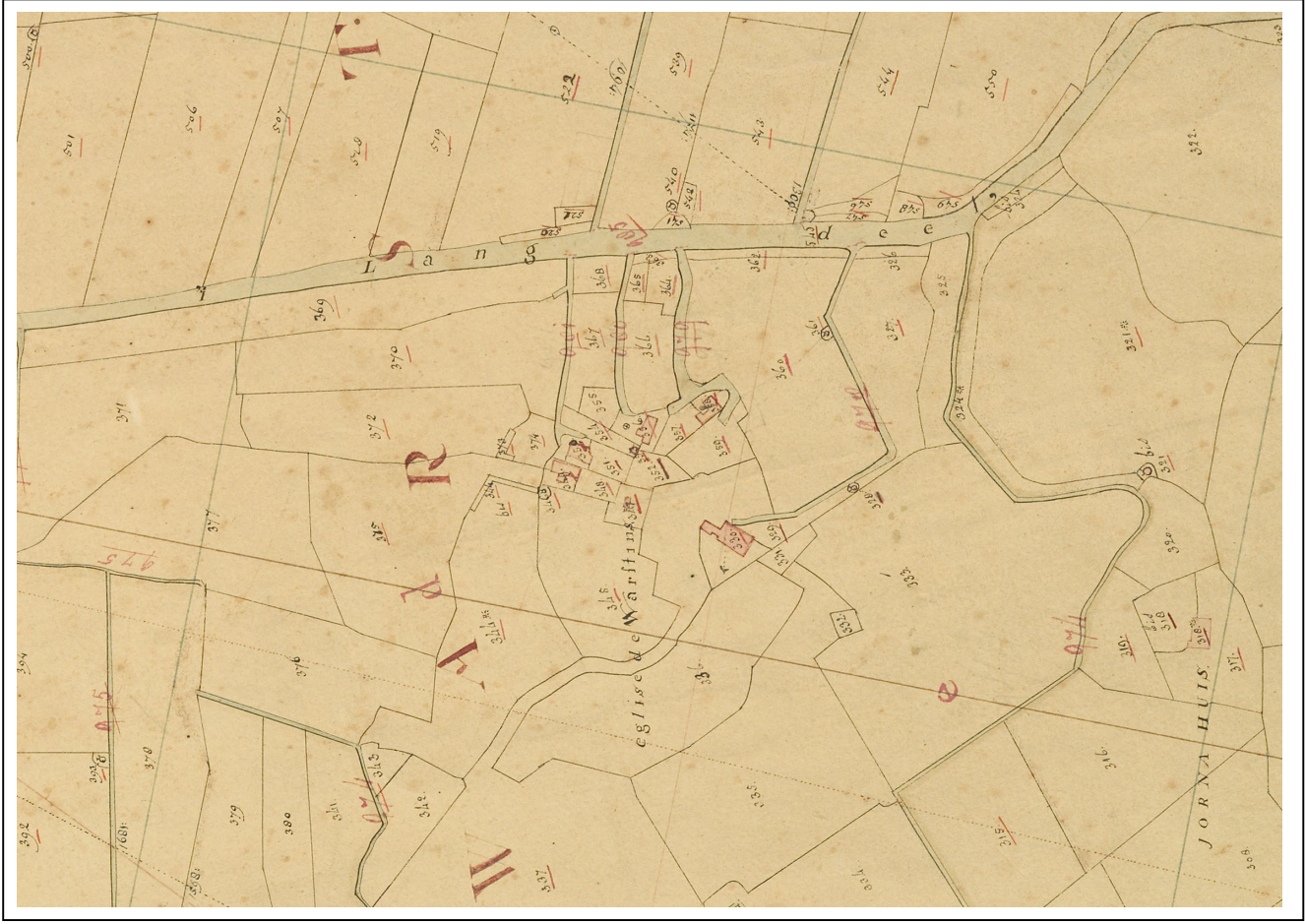
Kaart 2 Kadastrale kaart 1832, fragment