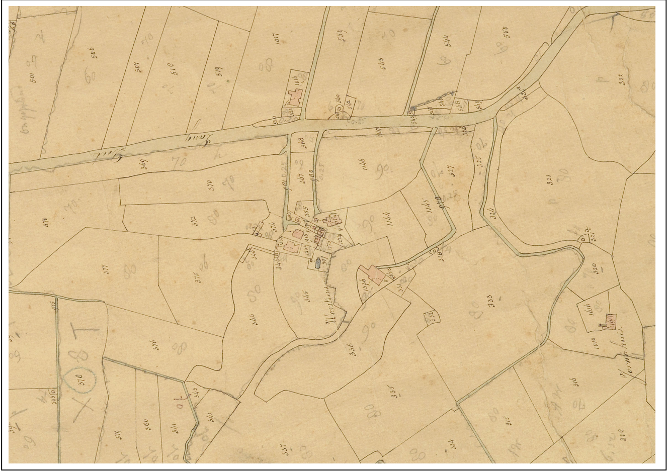
Kaart 3 Kadastrale kaart 1887, fragment