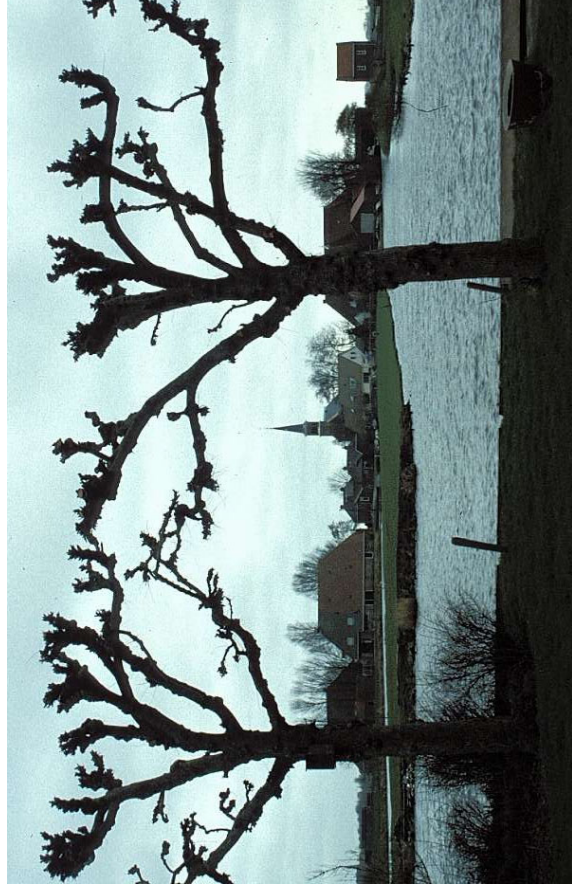
Foto: dorpsaanzicht oostzijde, vanaf Gerkeema State

bij het besluit tot aanwijzing van het beschermd dorpsgezicht Warstiens gemeente Boarnsterhim (Fryslân) ex artikel 35 Monumentenwet 1988