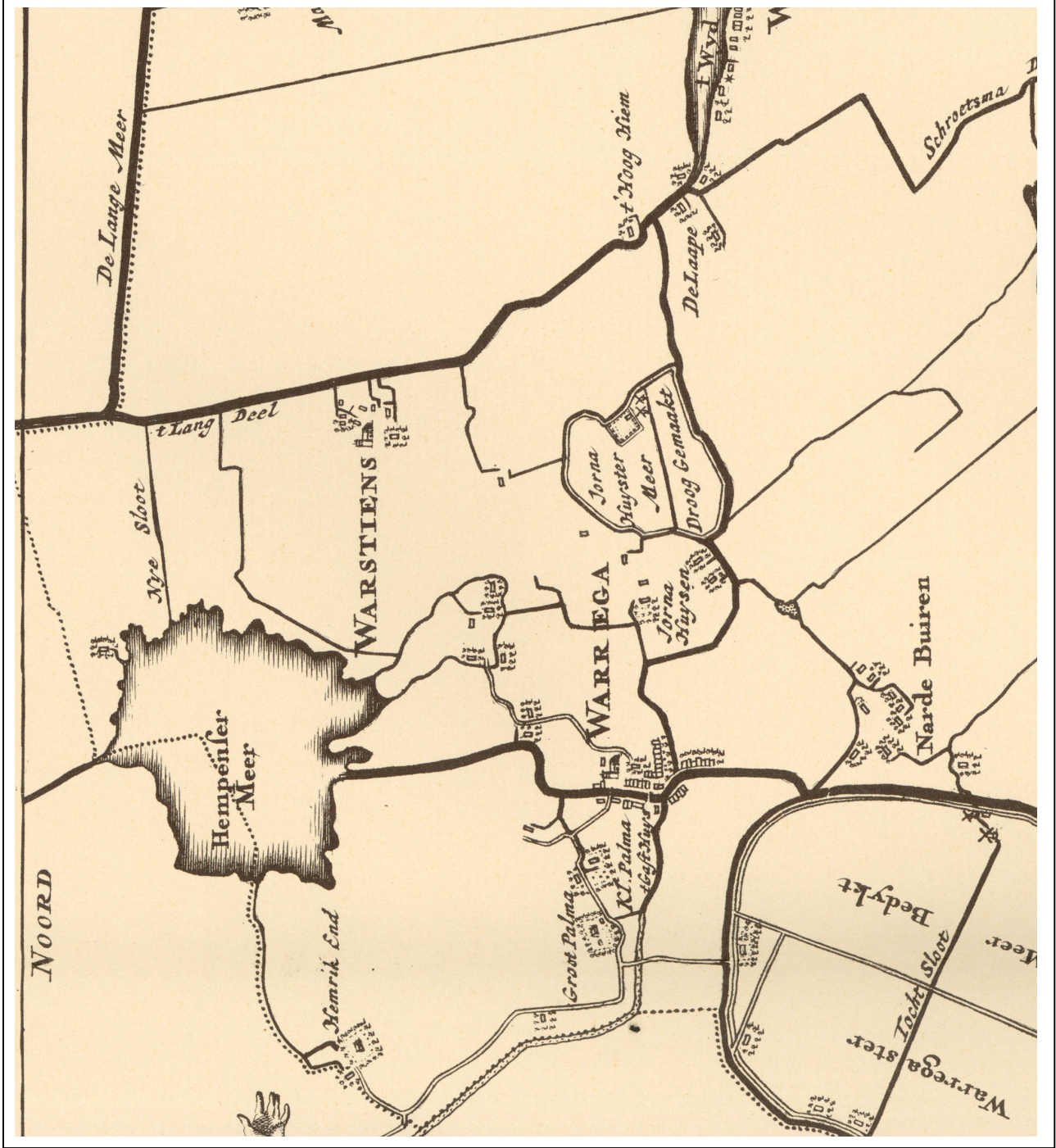
Kaart 1 Fragment, 1718