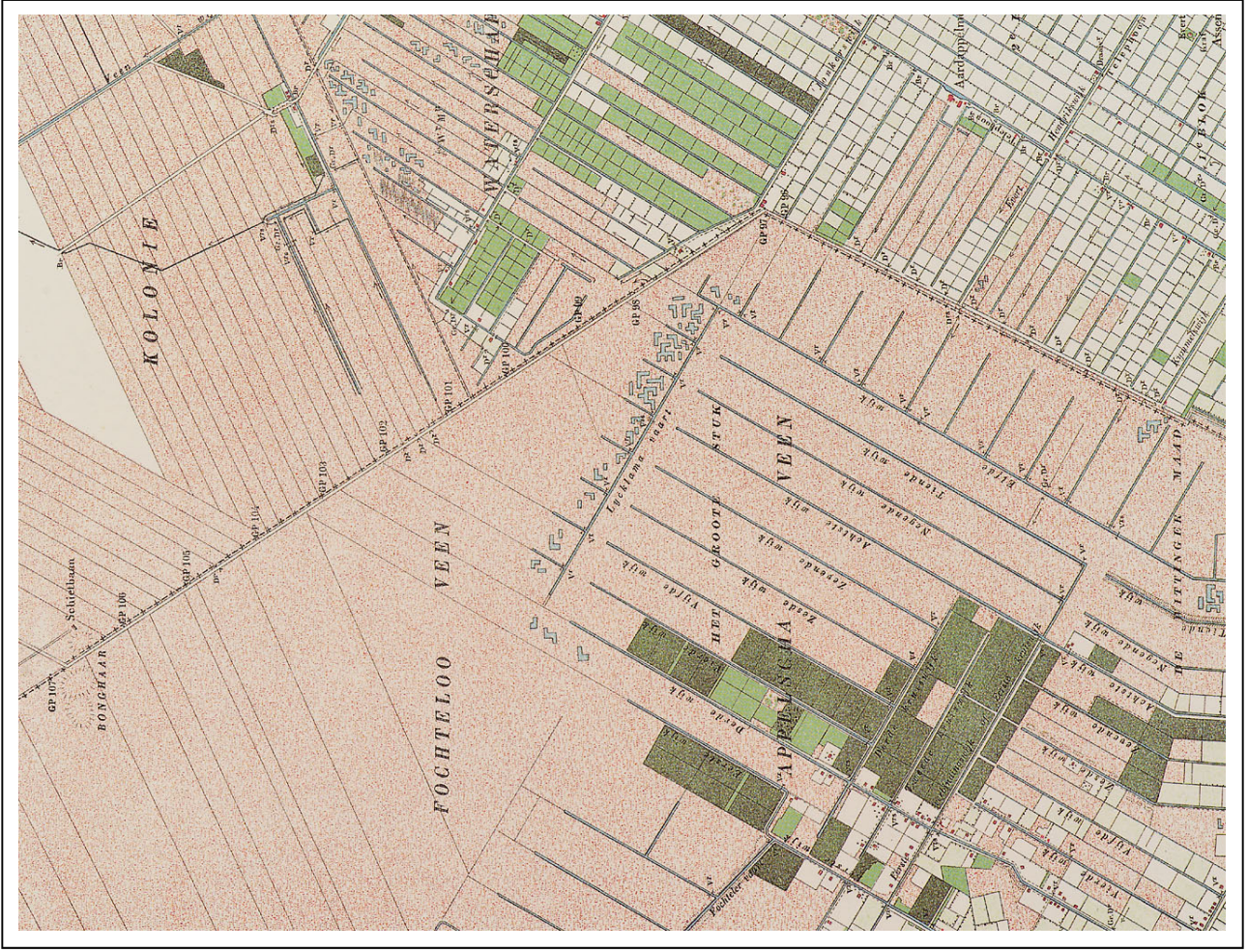
Kaart 4 Ravenswoud, 1896