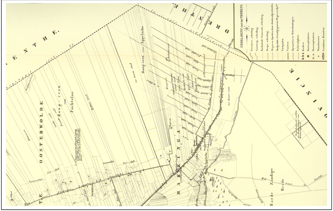
Kaart 3 Stellingwerf-Oostende, 1849, fragment