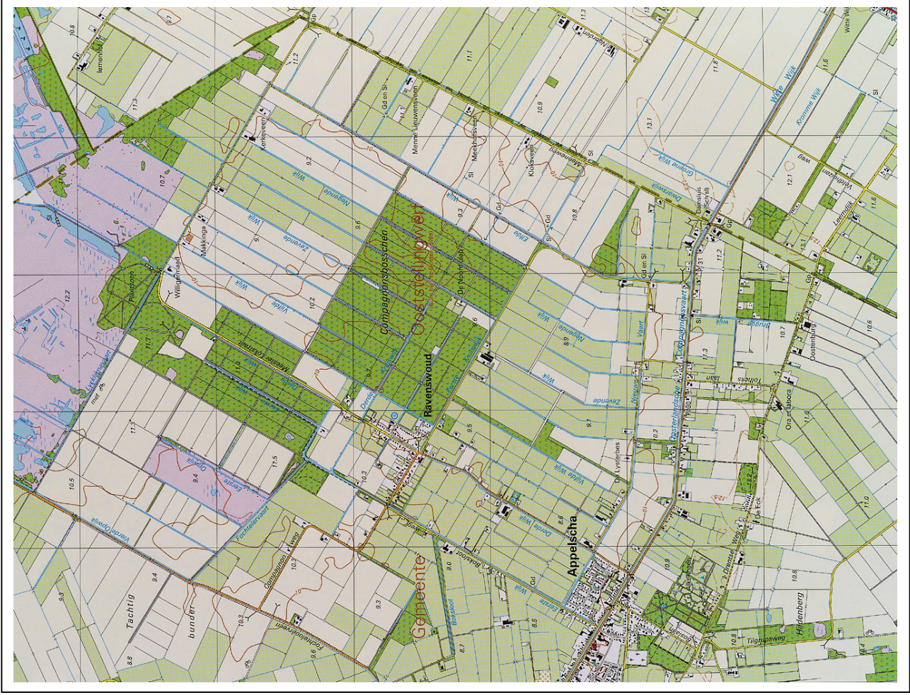
Kaart 1 Topografische kaart van Ravenswoud, huidige situatie