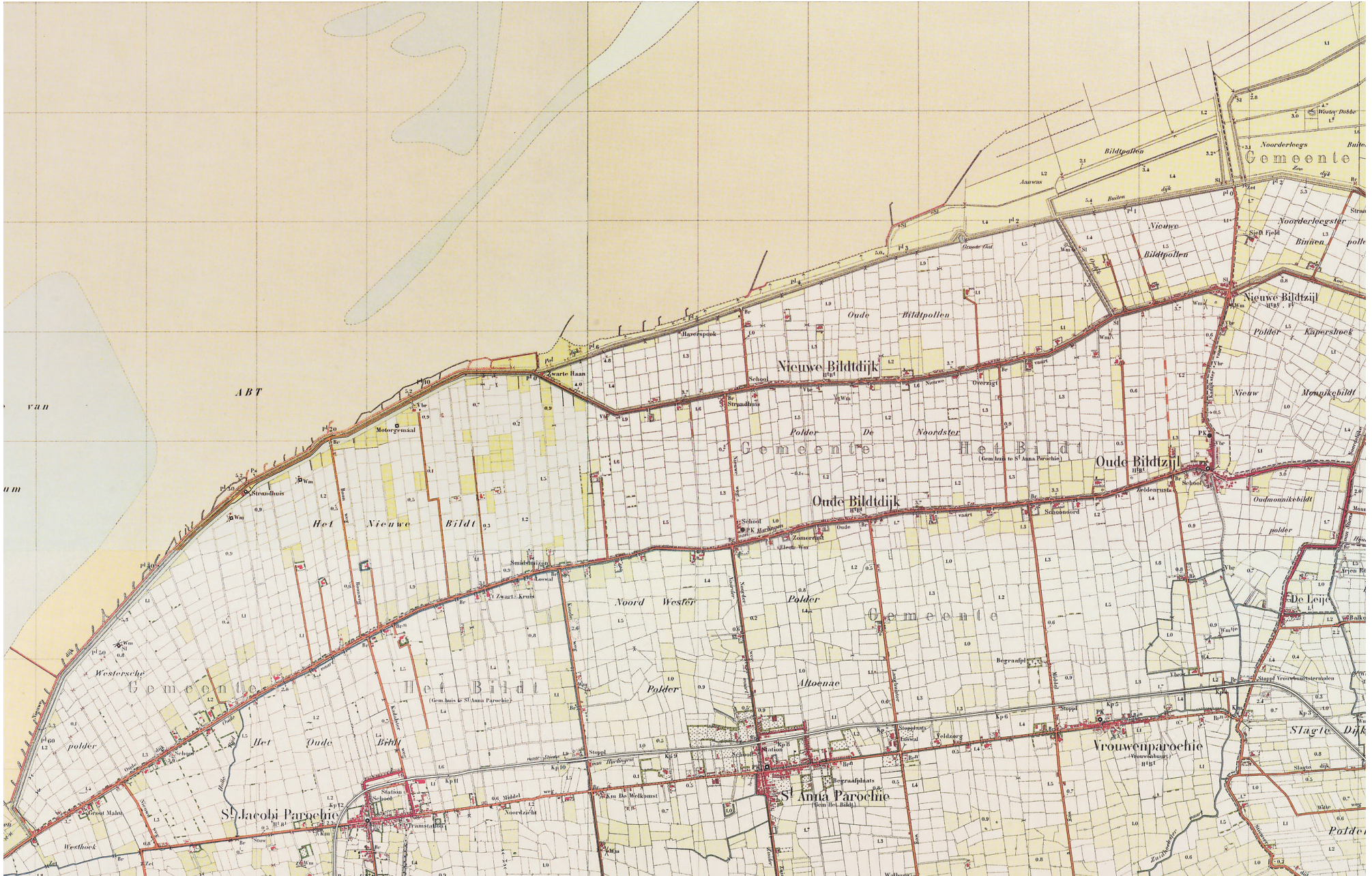
Kaart 4 Oude en Nieuwe Bildtdijken, 1929