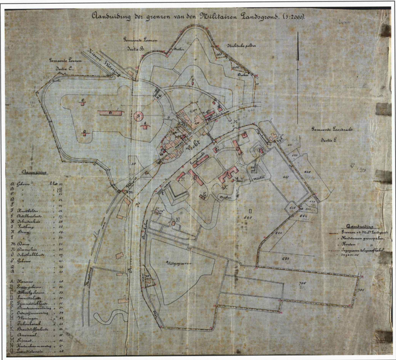
Kaart 4 Nieuwersluis, 1889