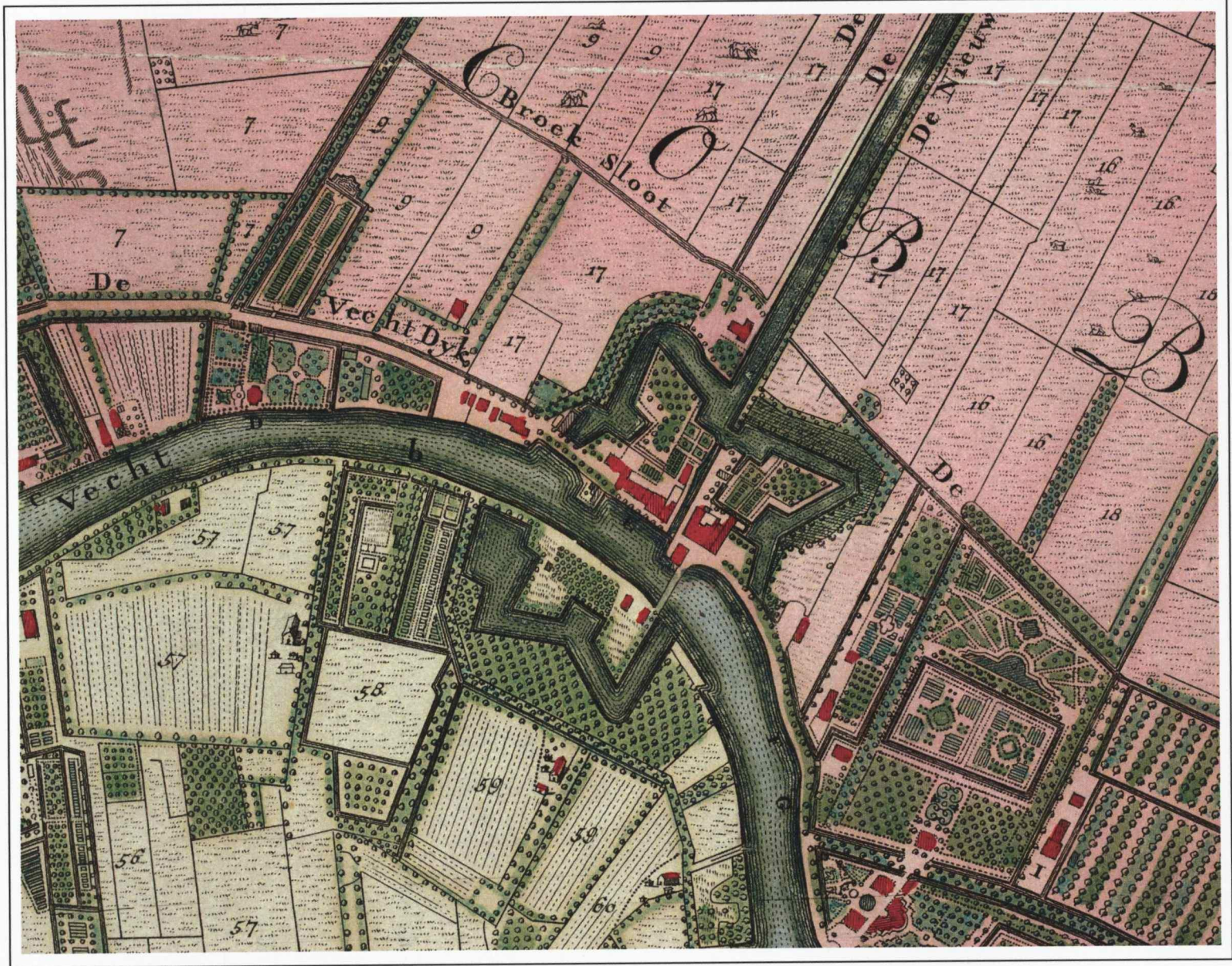
Kaart 2 Nieuwersluis, 1726