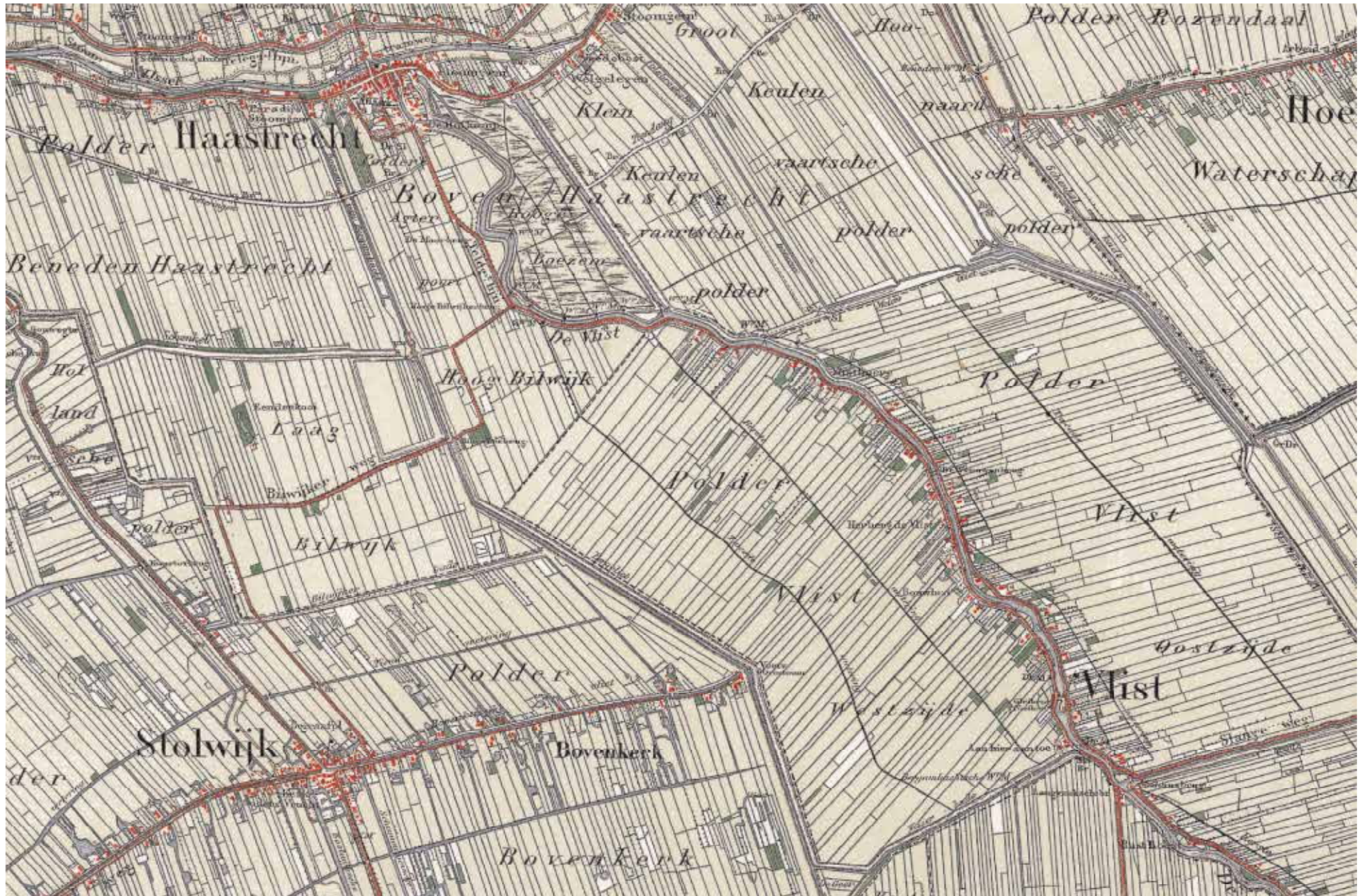
Kaart 2 Haastrecht omstreeks 1900