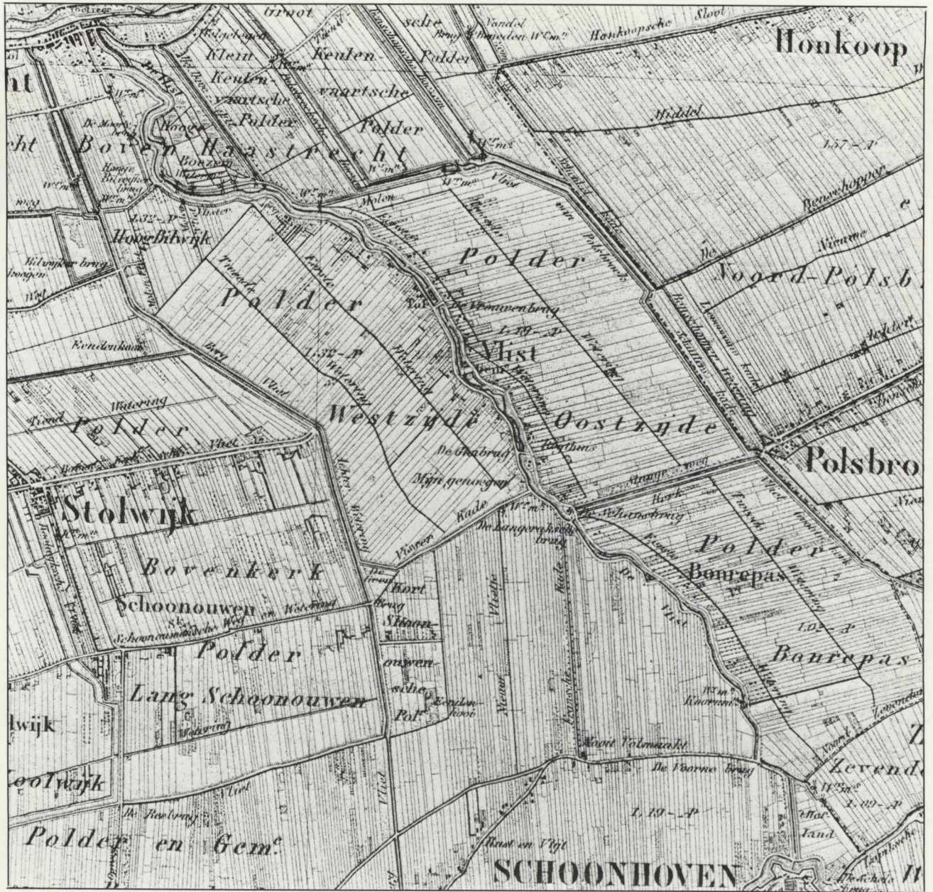
Afb. 2. Topographische en Militaire Kaart van het Koninkrijk der Nederlanden, 1973 (facsimile herdruk van 1858), blad 38, fragment.