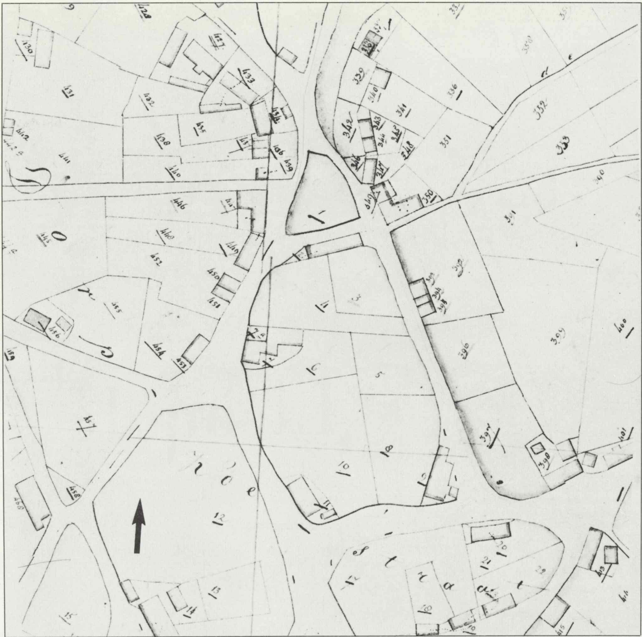
Afb. 2. Kadastraal Minuutplan gemeente Liempde, circa 1830, fragment raadhuisbuurt.