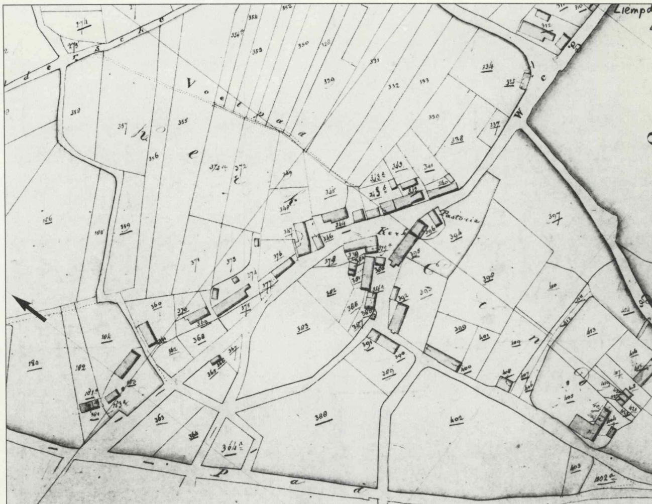
Afb. 1. Kadastraal Minuutplan gemeente Liempde, circa 1830, fragment kerkbuurt.