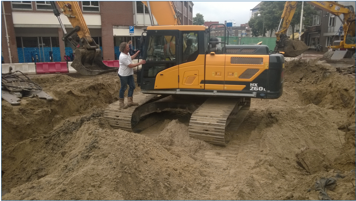
Figuur 3. De situatie in het plangebied bij de sloop.