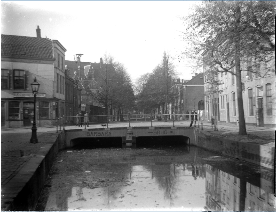
Figuur 2. De Barbarabrug aan het begin van de 20e eeuw.