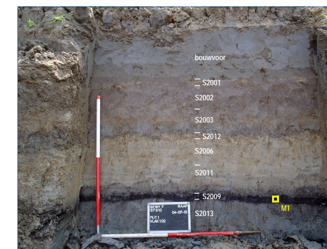
Profielkolom 4 met de locatie van het veenmonster (M1).