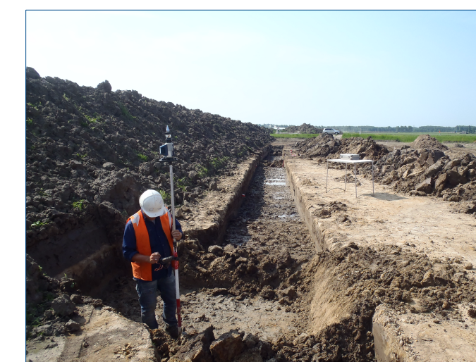
Overzicht van de profielsleuf ter hoogte van profielkolom 2 (de foto is in zuidelijke richting genomen).