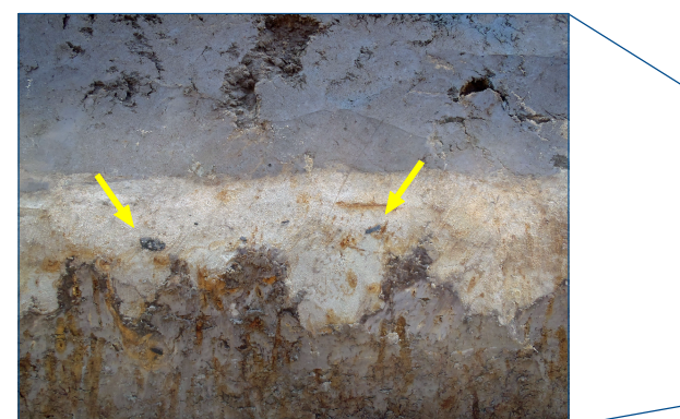
Detail van de dirty sands met enkele fragmenten aardewerk (zwarte vlekken).