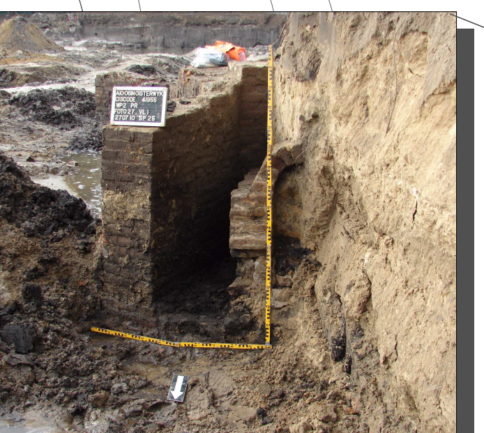
Bakstenen duiker uit de Nieuwe tijd.