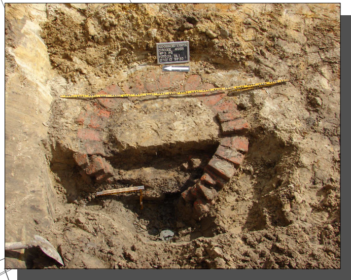
Bakstenen waterput (Nieuwe tijd) aangetroffen tijdens de archeologische begeleiding.