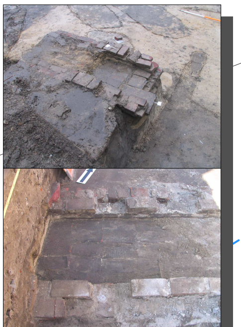
Bakstenen goot uit het einde van de 19e-begint 20e eeuw.