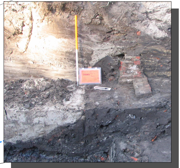
De Voorste Stroom is in de jaren '60 van de 20e eeuw omgelegd. In de gedempte beekvulling werden restanten van een loopbrug aangetroffen.