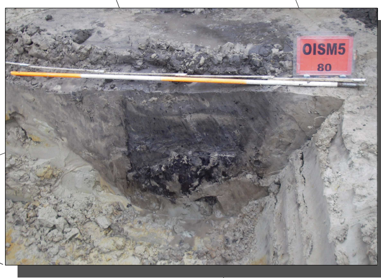
De vondst van vier middeleeuwse waterputten duidt erop dat het onderzoeksgebied een intensieve bewoning kende in de Middeleeuwen.