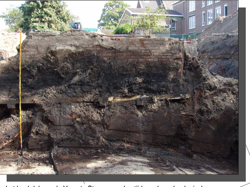
In het beekdal van de Voorste Stroom werden tijdens de archeologische begeleiding diverse muurrestanten en waterputten aangetroffen die in verband kunnen worden gebracht met het oude kloostercomplex Catharinenberg.