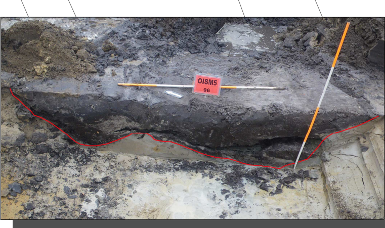
Tijdens de opgraving kwamen diverse greppels aan het licht. De meeste bevonden zich in het beekdal van de Voorste Stroom.