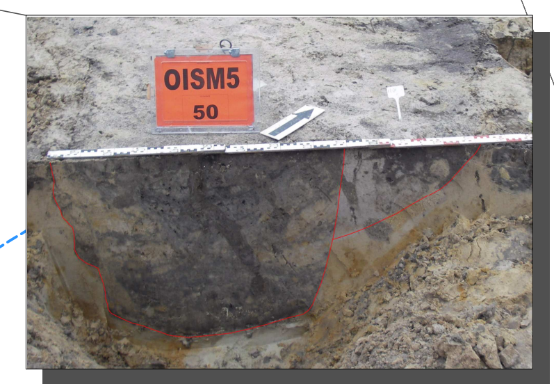
De middeleeuwse bewoningssporen bestonden voornamelijk uit kuiten.