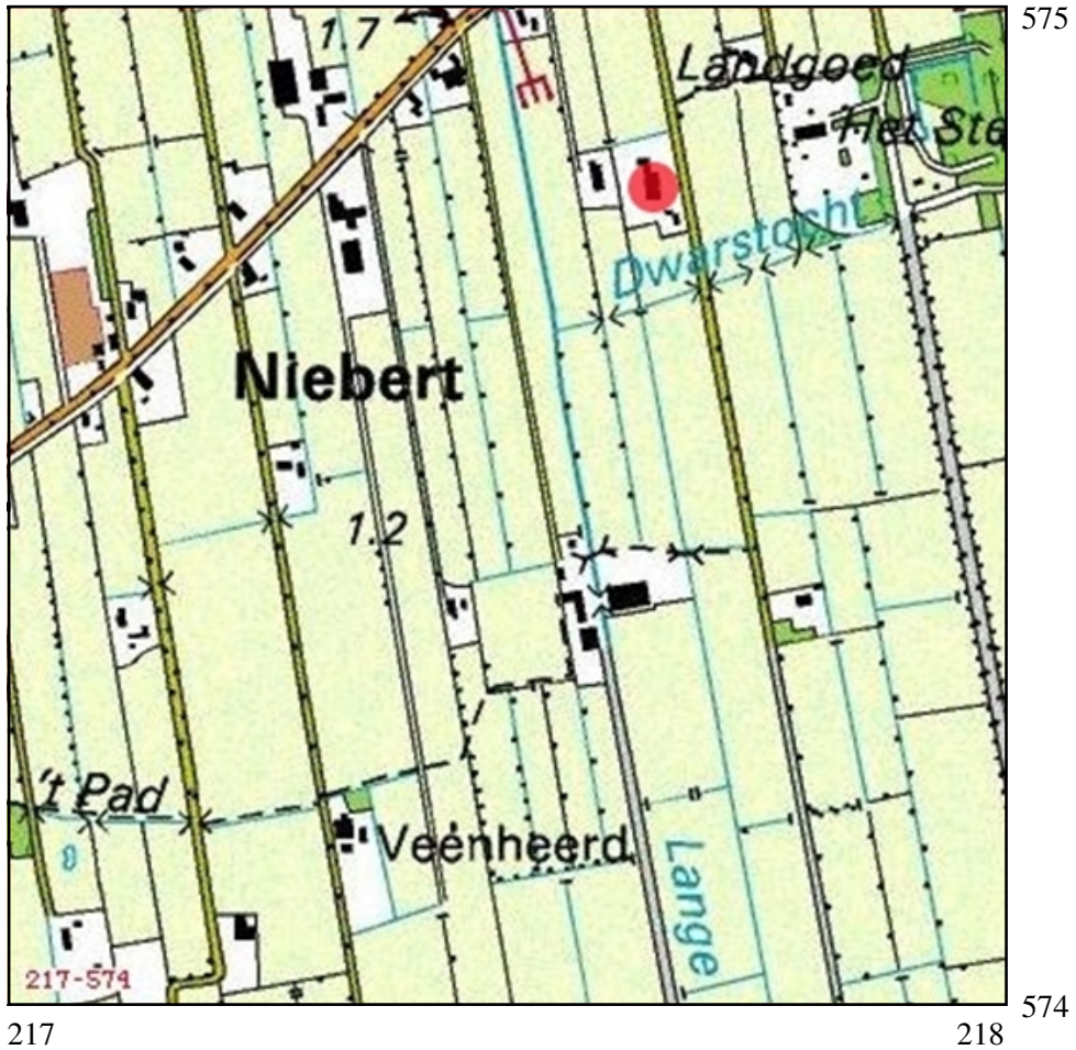
Afbeelding 1. Topografische kaart van de onderzoekslocatie (binnen rode stip) en omgeving, voorzien van RD-coördinaten.