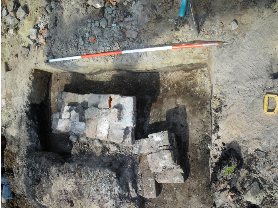
Afbeelding 2. Overzicht van het aangetroffen fundament.