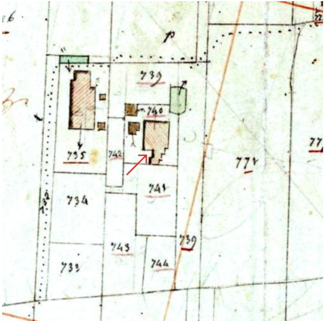
Afbeelding 4. Detail minuutplan uit 1832, de pijl wijst op de aangetroffen binnenhoek van het pand.